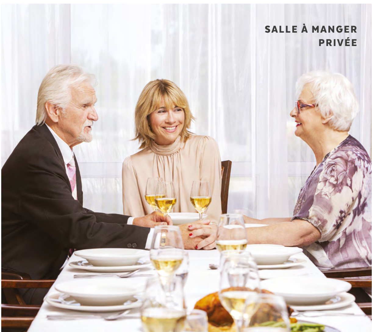
SALLE À MANGER PRIVÉE

Dans chaque résidence du Groupe Maurice, le plaisir de manger se traduit par la création de saveurs grâce à des produits frais, de saison et locaux. Vous offrir des plats concoctés avec finesse par nos chefs et servis agréablement à même votre table, telle est notre vision, et nous l'avons nommée « Orientation fraîcheur »!