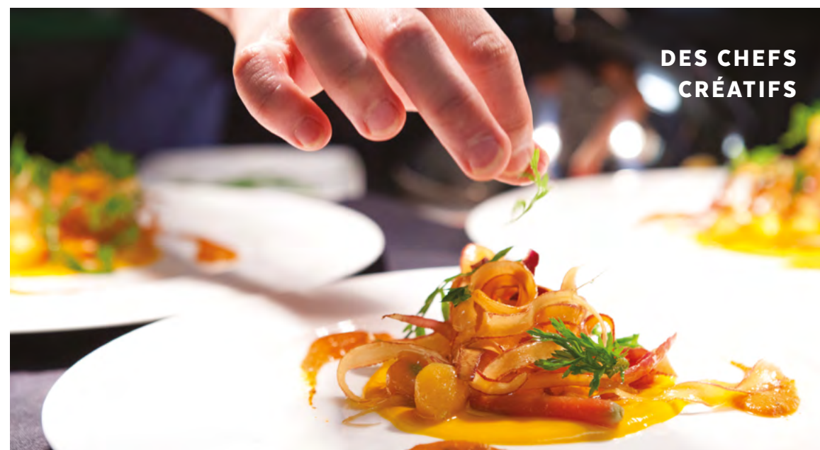
DES CHEFS CRÉATIFS